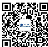
宝德技术支持公众号